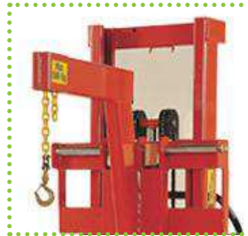
Braccio con gancio