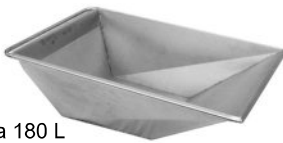
Vasca 180 L