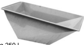
Vasca 250 L