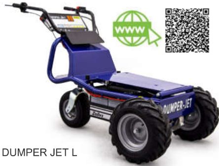
DUMPER JET L